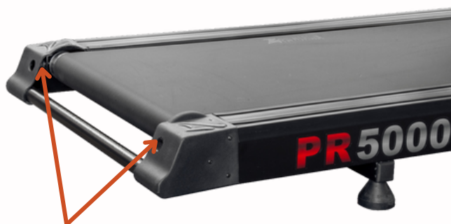
Parafusos de Regulagem da lona