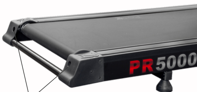
Parafusos de Regulagem da lona

Procedimentos de Regulagem da Lona 1 – Iniciar a esteira em velocidade de 6 a 7 km/h. 2 – Com “uma chave Biela ½” (meia polegada) gire o parafuso em sentido horário para esticar a lona. 3 – Para afrouxar a lona gire o parafuso em sentido anti-horário. 4 – Para centralizar a lona efetue pequenos giros em ambos os parafusos apertando ou afrouxando até centralizar a lona. 5 – Caso a lona estiver se movendo para a direita, gire o parafuso do lado direito no sentido horário para esticá-la ou o parafuso do lado esquerdo no sentido anti-horário para afrouxá-la, até que ela esteja centralizada. 6 – Caso a lona estiver se movendo para esquerda, gire o parafuso do lado esquerdo no sentido horário para esticá-la ou o parafuso do lado direito no sentido anti-horário para afrouxá-la, até que ela esteja centralizada. 6 – Com a esteira ligada na velocidade de 6 a 7 km/h tente frear a lona com um dos pés até perceber que não está mais patinando. 7 – Evite o excesso de tensão ao esticar a lona, pois poderá causar ruptura da emenda ou danos aos rolamentos.