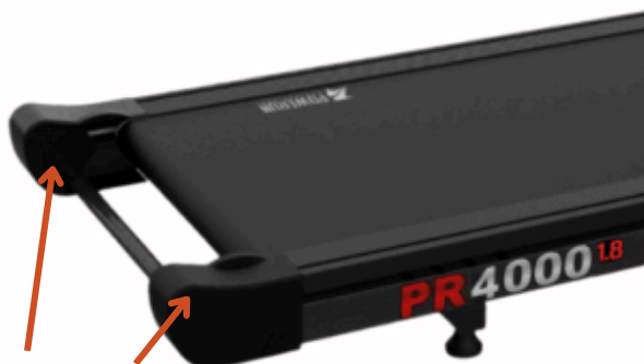
Parafusos de Regulagem da lona